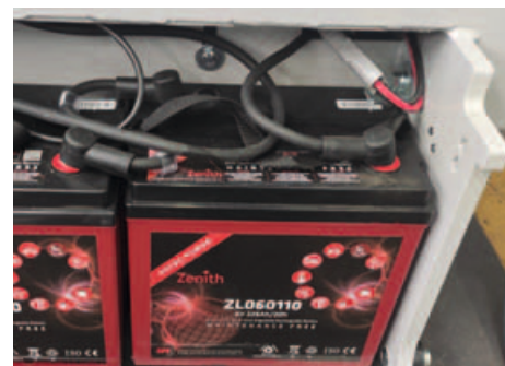
Compartiment pentru bateriile AGM