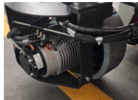
Motor electric AC; virare electrica pana la 90°