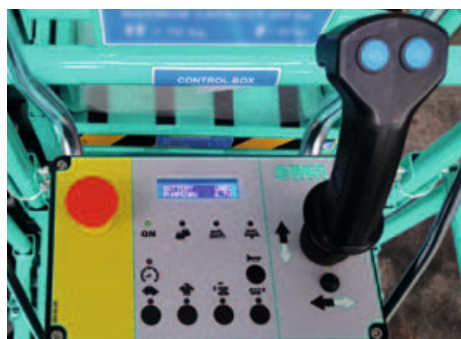
Panou de control detasabil cu butoane capacitive: simplitate si siguranta in utilizare