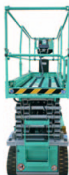
Noul design al PEA (platforma elevatoare autopropulsata) al pachetului de foarfece.