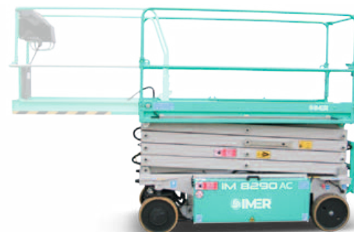
Extensie platforma 1.3 m.